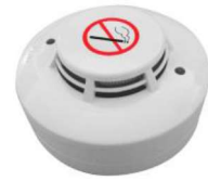
CDR-727 pro ústřednu EZS