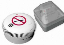
CDA-707R autonomní + externí signalizace